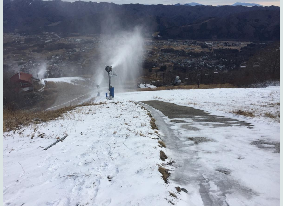
2018年12月 日中も降雪機を稼働し下山ルートを確認