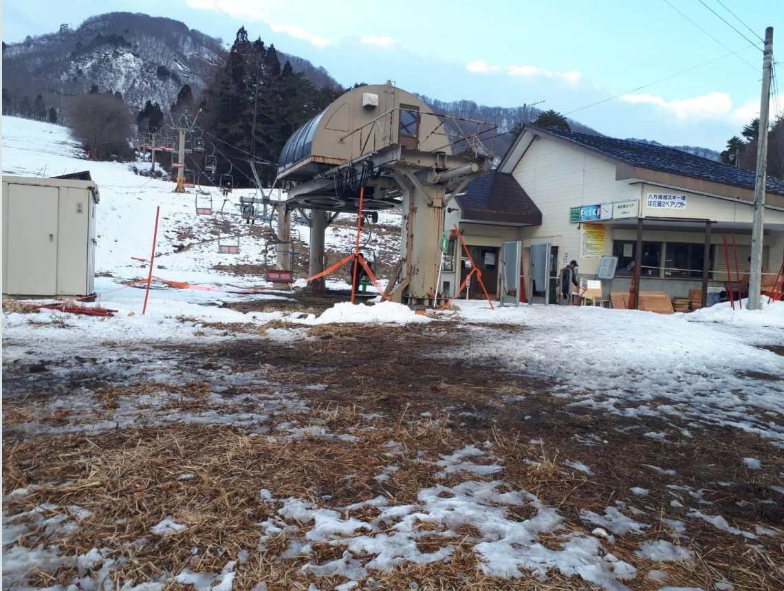
2020年2月の咲花ゲレンデ