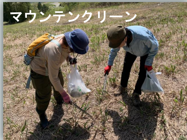
マウンテンクリーン